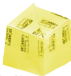
Innerhörn: ISOVER Vario® TightTec I