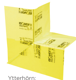
Ytterhörn: ISOVER Vario® TightTec X