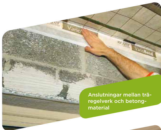
Anslutningar mellan träregelverk och betongmaterial