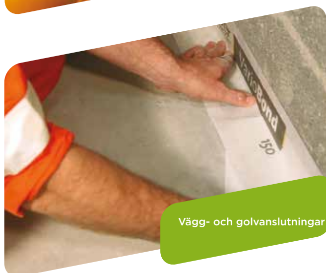
Vägg- och golvanlutningar